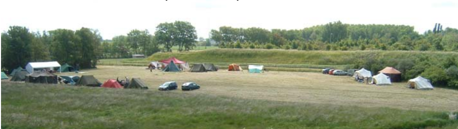
Scouts op Pinksterkamp in Brouwershaven