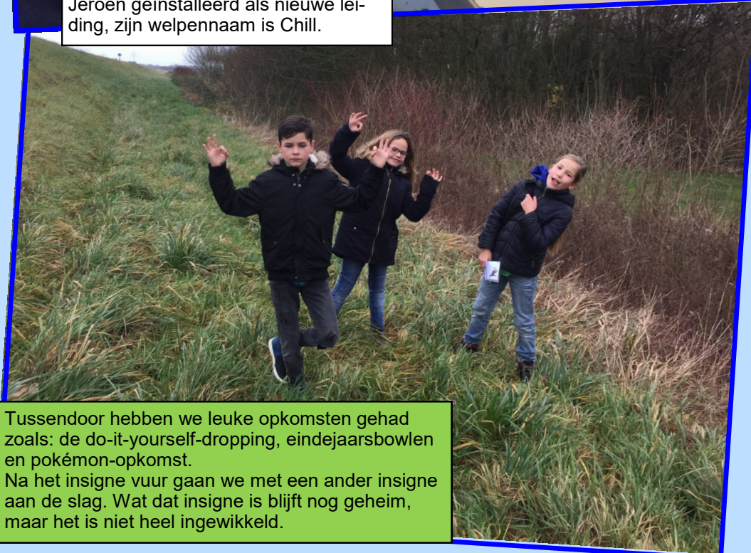
Tussendoor hebben we leuke opkomsten gehad zoals: de do-it-yourself-dropping, eindejaarsbowlen en pokémon-opkomst. Na het insigne vuur gaan we met een ander insigne aan de slag. Wat dat insigne is blijft nog geheim, maar het is niet heel ingewikkeld.